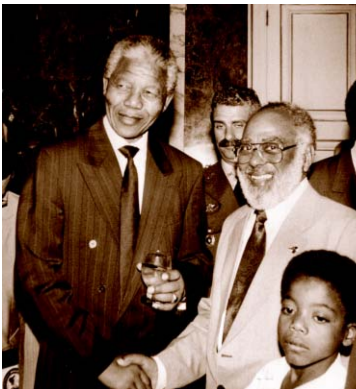
ABDIAS DO NASCIMENTO COM O EX-PRESIDENTE DA ÁFRICA DO SUL, NELSON MANDELA

Luta - A história de Abdias do Nascimento teve início em Franca, no interior paulista, em 14 de março de 1914. Filho de uma doceira e um sapaiteiro, desde cedo já lutava por seus objetivos e ideais. Voltava da escola indignado pela forma injusta como era tratado por colegas e professores. Mas aprendeu com sua mãe a não deixar nenhuma ofensa racial sem resposta. Adolescente, foi para São Paulo e logo engajou-se em movimentos afros, sendo um dos fundadores, aos 17