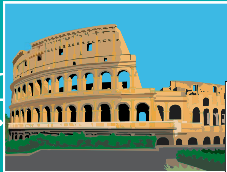
Coliseu [Roma, Itália] Inaugurado no ano 80 pelo imperador Tito, chegou a reunir quase 90 mil pessoas para assistir aos combates entre gladiadores.