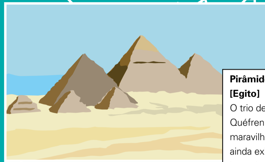
Pirâmides de Gizé [Egito] O trio de pirâmides de Quéops, Quéfren e Miquerinos é a única maravilha do mundo antigo que ainda existe. Foram erigidas há mais de 4,4 mil anos, para abrigar a cripta dos faraós.