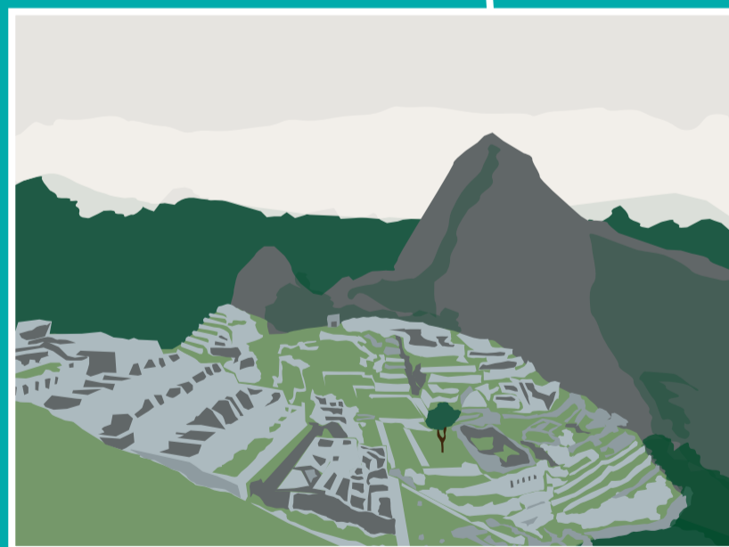
Machu Pichu [Cuzco, Peru] Conhecida como a "cidade perdida dos incas", foi descoberta em 1911. Localizada em uma montanha, as ruínas possuem templos sagrados e mausoléus reais.