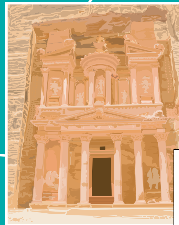
Petra [cidade arqueológica na Jordânia] Esculpida na pedra pelos nababeus, que viveram na região entre 9 a.C. e 40 d.C. O templo mais importante do conjunto arquitetônico é Al Khazneh, de estilo helenístico.

Este cartaz é parte integrante da Revista NÓS DA ESCOLA n.º 52