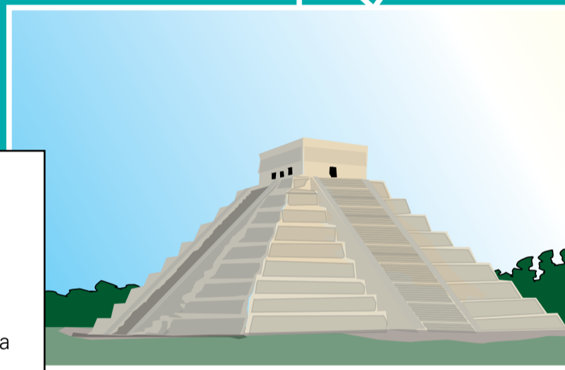
Pirâmide de Chichén Itzá [Yucatán, México] Dedicado ao deus Kukulkán, o templo foi erguido antes do ano 800. Chichén Itzá era o centro político e econômico da civilização maia.