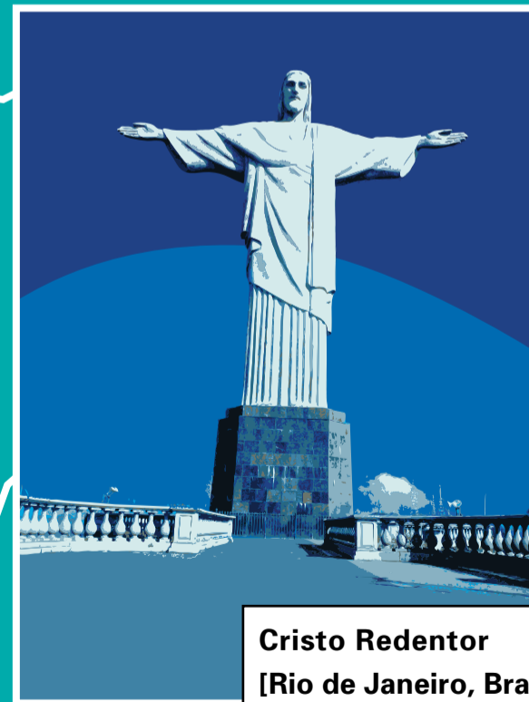
Cristo Redentor [Rio de Janeiro, Brasil] Com 38m de altura e a 709m acima do nível do mar, o Cristo foi inaugurado em 1931. A pedra que reveste a estátua é do próprio Morro do Corcovado.